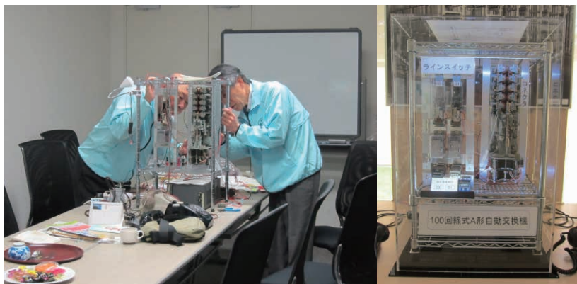
写真1 A形自動交換機の復元作業

前回のA形交換機よりさらに古い磁石式手動交換機は回路図等の資料があまりなく、まさに手探りで配線や各スイッチの機能を確認めていきました。また真鍮製のプラグやジャックの酸化被膜にも悩まされました。さまざまな苦勞を乗り越え実際に使用できる状態となった磁石式手動交換機は、「動態である」ことが評価を受け国立科学博物館の重要科学技術史料(愛称:未来技術遺産)に登録されました。