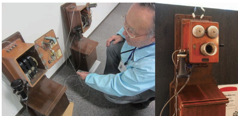
写真3 デルビル磁石式電話機の復元作業

(3) デルビル磁石式電話機 2015年7月 デルビル磁石式壁掛電話機(デルビル電話機)(写真3)は「当時の部品だけで復元し、来館者には当時の音質を体験いただき、古い電話機に触れることで昔を偲ぶよすがとなれば」という宅内系サポーターの思いで復元されました。それまで体験していただいていたデルビル電話機は、現在の技術で補強したのもだったので、手動交換機と同様に回路図がほとんど残っていない状況で、部品を動かしながらその機能を確認めました。また、炭素粉や振動板といった材料の確保にも苦勞をしました。電池以外すべて当時の部品で復元されたデルビル電話機は、子どもから大人まで多くの方に「テレビや映画で見た古い電話機はこうやって使っていたのですね!」と好評を博しています。