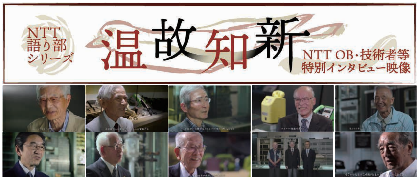
写真4 NTT語り部シリーズ温故知新出演者一覧

理系学生向けの講演「語り部の会」を実施し、現在まで25回開催しています。 ・社会科学：学校教育と連動した社会科学見学プログラムで、当時の研究開発での苦労話や次世代へのメッセージビデオに出演したり、新入社員研修の一環としてトークセッションをしたりなど多方面で協力をいただきました。 ・NTT語り部シリーズ「温故知新」：2020年からはNTT語り部シリーズ「温故知新」として、論文や研究資料では言及されない「研究者の想い」を語っていただく映像アーカイブに出演いただいています* 2 (写真4)。