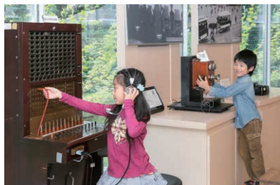
写真2 復元された磁石式手動交換機を楽しむ様子

図書館の回路図集を読み解き、実物と回路図を突き合わせながら1本1本確認し配線、電話機を接続し動作したときの喜びはひとしおだったそうです。接続した4号自